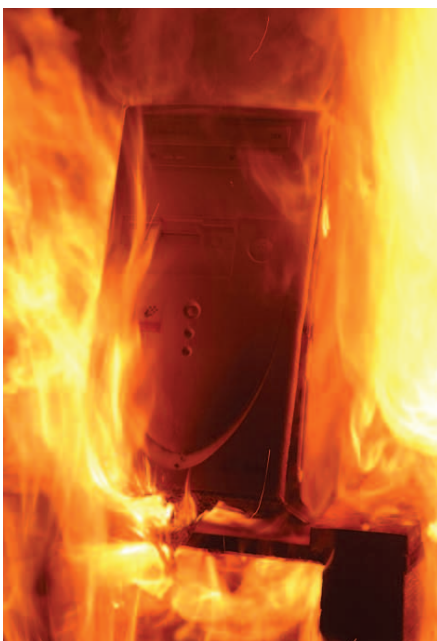
Der L.I.B. verhindert das Disaster.

Er bietet Ihnen optimalen Schutz nicht nur für Ihr Netzwerk, sondern auch für alle Daten auf PCs und Laptops.